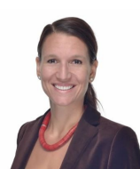
Désirée Stocker Stiftung Artisana